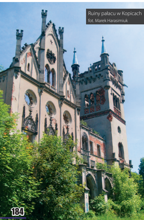
Ruiny pałacu w Kopicach