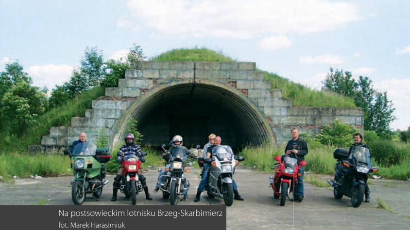
Na postsowieckim lotnisku Brzeg-Skarbimierz

Po tym chwilowym rozprostowaniu nóg wyruszamy drogą nr 385 do nieodległych Kopic. W samych Kopicach trzeba zjechać z głównej drogi, aby po kilkuset metrach