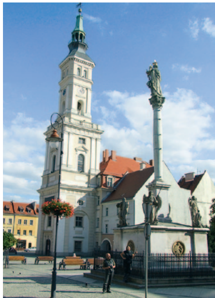
Na rynku w Prudniku

Głogówka . W herbie tego miasta, podobnie jak w herbie Brzegu, również znajdziemy roztrój, tylko zamiast kotwic są tutaj trzy sierpy i trzy winne grona. Kilka stuleci temu, zapewne w średniowieczu, miasto dopadła plaga „globalnego ocieplenia” niewątpliwie spowodowana ludzką działalnością polegającą na wydalaniu gazów cieplarnianych. Przez tę nieodpowiedzialną postawę możliwa stała się uprawa ciepłolubnej rośliny, jaką jest winorośl, z której wytwarzano krajowe wina. W tym leżącym w żyznej okolicy mieście też obejrzymy kilka zabytków.