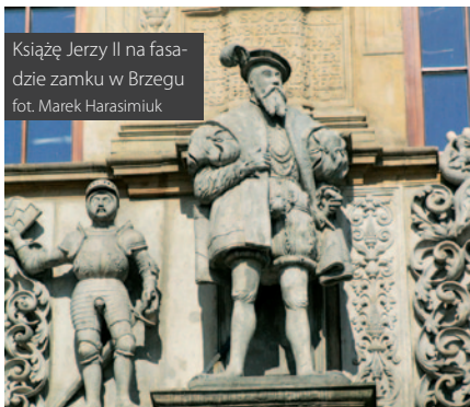
Książę Jerzy II na fasadzie zamku w Brzegu

Na początek czeka nas zwiedzanie zamku Piastów śląskich (tak, tak, Opolszczyzna to przecież nic innego tylko Śląsk Opolski). To w Brzegu