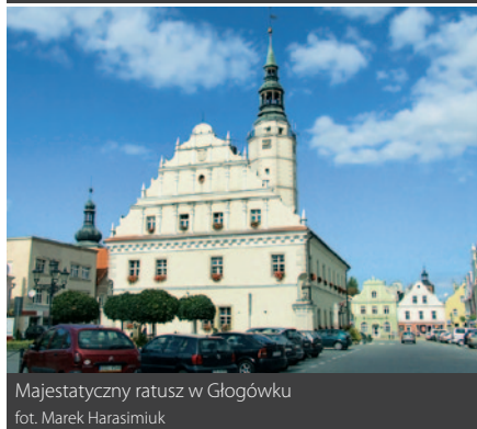
Majestąteczny ratusz w Głogówku