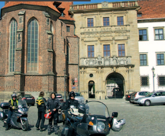
Przed zamkiem w Brzegu

w niewielkim stopniu. Po wojnie został z ramienia państwa przyznany nowym właścicielom, dopuszczono do rozgrabienia jego wyposażenia, a sam zamek popadł w ruinę. Obecnie nie ma dostępu do zabytku, gdyż teren jest prywatny, a gospodarz nieuchwytny. Z daleka jednak widać, że o obiekt należyście zadbano, w przeciwieństwie do jego otoczenia, które bardziej przypomina dzikie knieje niż przyzamkowy park. Tajemniczy zamek