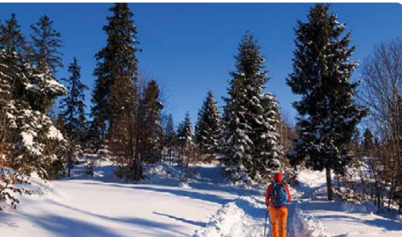
W drodze na Turbacz

szczytowej (wielkopowierzchniowe wiatrołomy) stał się niezłym miejscem widokowym – panorama jest co prawda tylko częściowa i zaburzona stojącymi tu i ówdzie ocalałymi świerkami oraz kikutami zniszczonych drzew, jednak zdecydowanie „coś” (np. Tatry) stąd widać. Nieco lepszych widoków warto poszukać tuż poniżej wierzchołka (obelisk i stojący obok żelazny krzyż wciąż otacza kępa drzew). Wielu turystom nazwa „Turbacz” kojarzy się przede wszystkim z popularnym schroniskiem. Położone na zachodnim skraju Hali Długiej być może pośrednio zawdzięcza swoją lokalizację... kłusownikom. Pierwsze bowiem schronisko pod Turbaczem wybudowano w 1925 r. na pobliskiej polanie Wisielakówce; działało ono zaledwie 8 lat. W 1933 r. zostało podpalone – jak „wieś gminna” nie sie – właśnie przez kłusowników, dla których rozwój turystyki był zdecydowa-