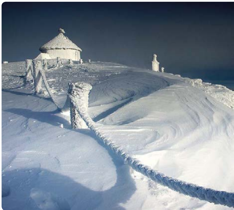
Śnieżka, kaplica św. Wawrzyńca

Czecha, wybudowane jeszcze w 1894 r. jako niemieckie schronisko Schlingelbaude. Droga zakręca tu w kierunku północno-wschodnim. Na północnym skraju Polany widać skały zwane Kotkami. Z tego miejsca w nie więcej niż 20–25 min docieramy do kościoła Wang w Karpaczu Górnym i ulicy Karkonoskiej – głównej arterii miasta. Do centrum Karpacza jest stąd jeszcze dość daleko – w okolicy nieczynnej stacji kolejowej najlepiej jest dojść zielonym szlakiem (to jeszcze prawie 4 km!). Możemy też skorzystać z taksówki lub komunikacji publicznej.