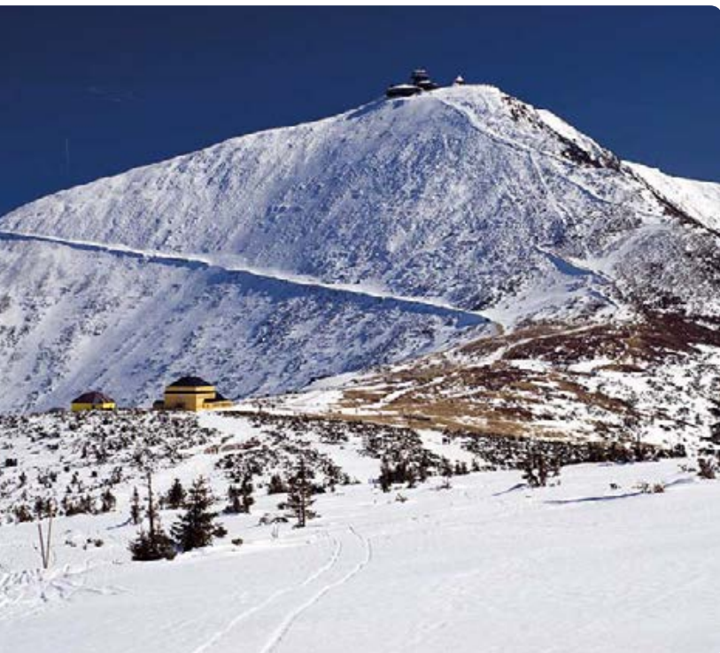
Śnieżka; poniżej widoczne schronisko Dom Śląski

Przy schronisku szlak niebieski biegnie na wprost do położonego w dole (ok. 60 m niżej), nad Małym Stawem, kultowego schroniska „Samotnia”. Na-