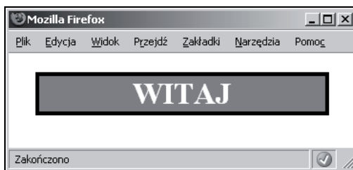
Rysunek 7.1. Witryna stosująca style

Rysunek 7.1 przedstawia wygląd opisanej witryny. Trzy podane przykłady: pierwszy ze stylami zewnętrznymi, drugi stosujący style wewnętrzne i trzeci wykorzystujący atrybut style , mają identyczny wygląd.