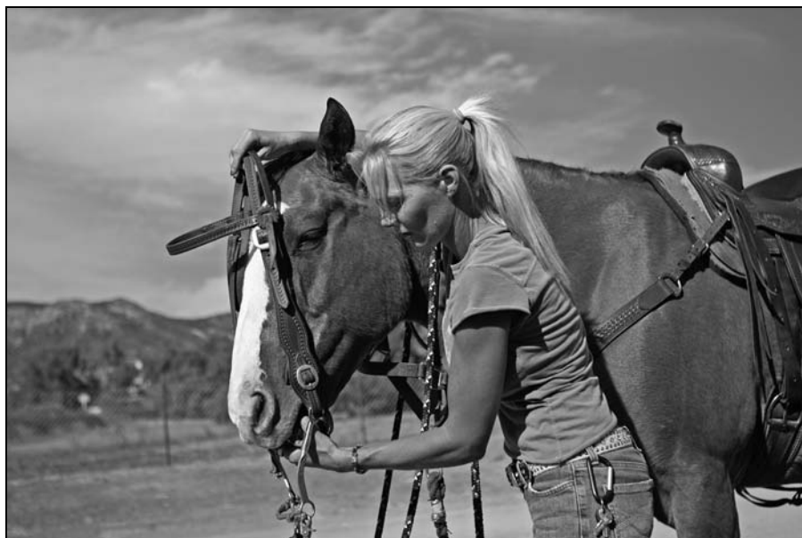
Rysunek 11.8. Zakładanie ogłowia typu western