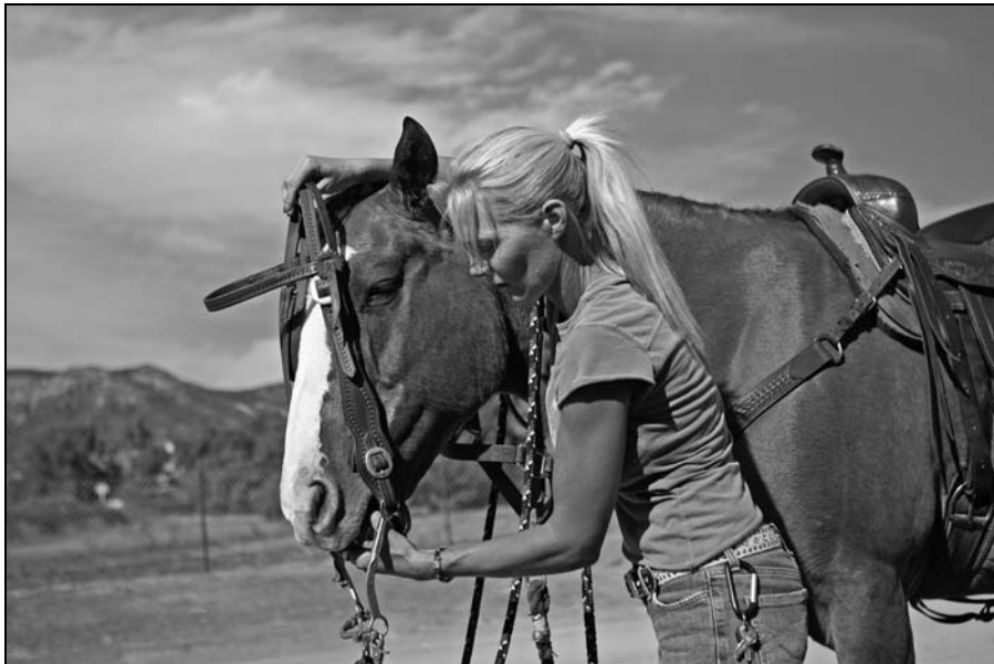
Rysunek 11.8. Zakładanie ogłowia typu western