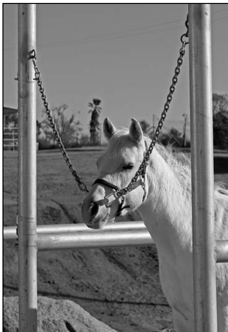
Rysunek 11.4. Koń uwiązany podwójnie za pomocą łańcuchów

Upewnij się, że koń, z którym pracujesz, został przyzwyczajony do takiego rodzaju wiązania. Jeżeli nie, może się przestraszyć, gdy go w ten sposób uwiążesz. Upewnij się też, że zapięcia mają możliwość łatwego zwolnienia, aby koń nie zawisnął na uwiązach, jeśli spanikuje. Chodzi o zabezpieczenie, które zwalnia się, jeżeli koń zaczyna oddziaływać na wiązania z ogromną siłą.