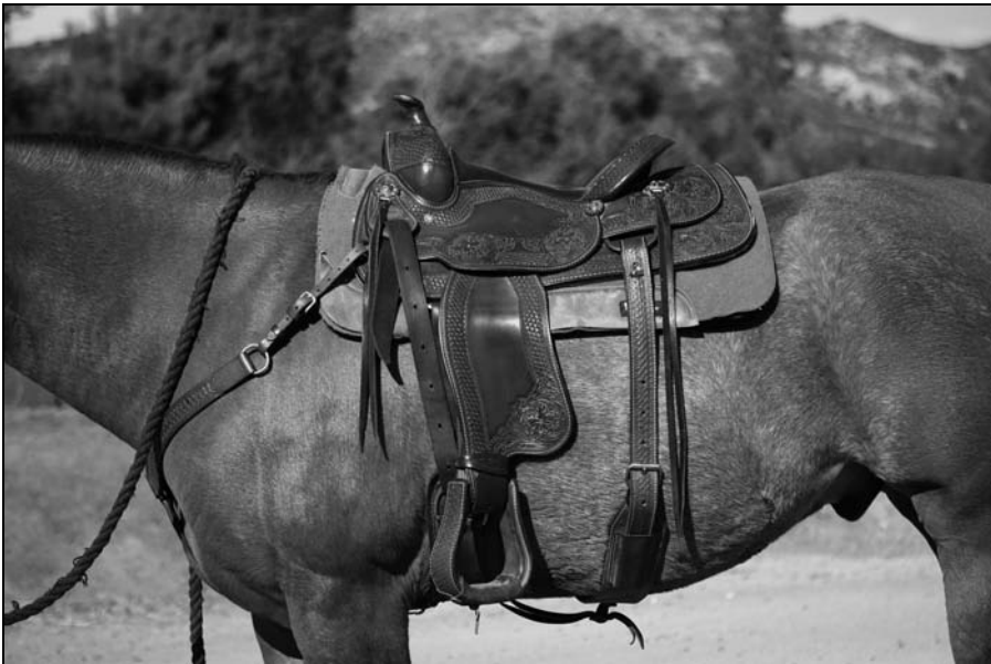
Rysunek 11.6. Prawidłowo umiejscowione siodło typu western

Ustaw się po lewej stronie konia i unieś siodło ku górze i nad konia. Nałóż je delikatnie na koński grzbiet. Siodło powinno znaleźć się w przestrzeni poniżej kłębu. Należy je umieścić w taki sposób, aby z przodu i z tyłu wystawało spod niego po około 8 centymetrów czapraka. Aby potwierdzić prawidłowe ułożenie siodła na końskim grzbiecie, należy sprawdzić, czy popręg po zamocowaniu znajdzie się tuż za stawami łokciowymi (na rysunku 11.6 przedstawione zostało prawidłowe umiejscowienie siodła typu western).