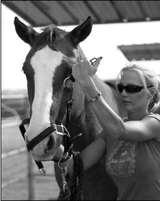
Rysunek 11.1. Zakładanie kantara od lewej strony