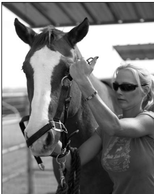
Rysunek 11.1. Zakładanie kantara od lewej strony