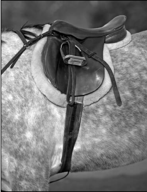
Rysunek 11.7. Popręg można ułożyć we właściwym miejscu, jeśli uprzednio prawidłowo nałożono się siodło

Przeprowadź tę samą procedurę zapinania popręgu, która została opisana w rozdziale 6. Przed zapięciem popręgu upewnij się, że znajduje się on tuż za stawami łokciowymi konia. Upewnij się też, że nie jest wykrzywiony ani niczym zabrudzony. Dopnij go tak, żeby ściśle przylegał.