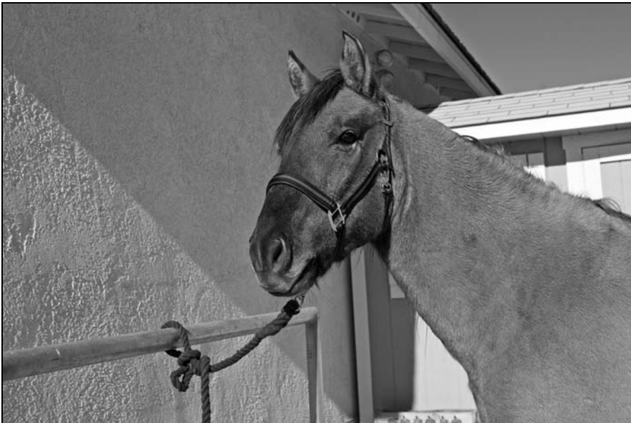
Rysunek 11.5. Krótka lina gwarantuje, że koń będzie uwiązany w bezpieczny sposób