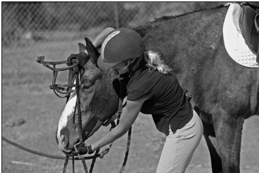
Rysunek 11.9. Zakładanie ogłowia typu klasycznego

Jeżeli wędzidło ma łańcuszek, należy zadbać o to, aby zwisał swobodnie, gdy wodze są poluzowane, a jednocześnie łąpał kontakt z podbródkiem konia, gdy czanki zostaną ściągnięte do 45 stopni.