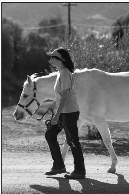
Rysunek 11.2. Prowadząc konia, idź przy jego lewej łopatce i kieruj wzrok ku swojemu celowi