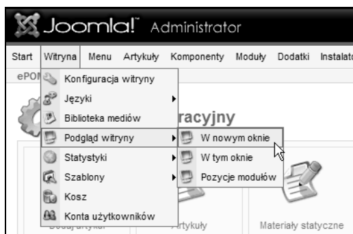
Rysunek 4.10. Joomla! 1.0.11 — podgląd witryny