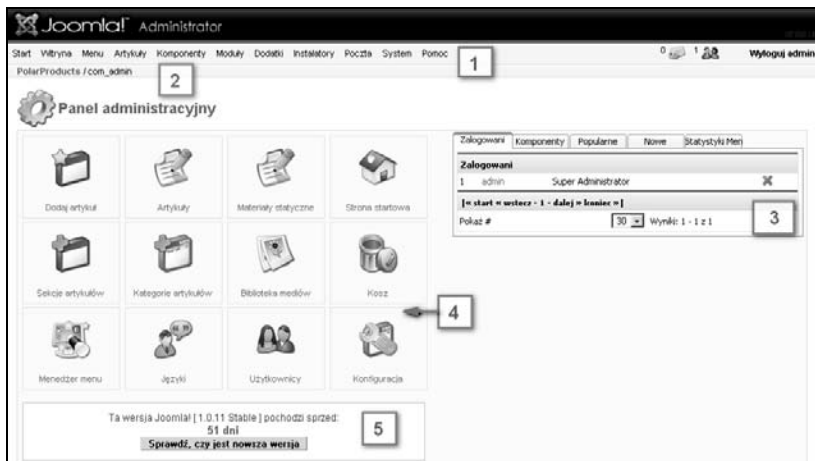
Rysunek 4.3. Joomla! 1.0.11 — panel administracyjny