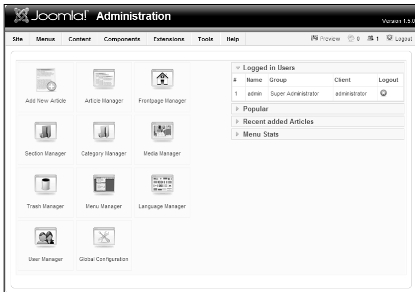
Rysunek 4.4. Joomla! 1.5 — panel administracyjny