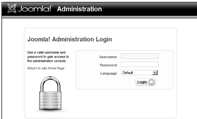
Rysunek 4.2. Joomla! 1.5 — okno logowania do systemu