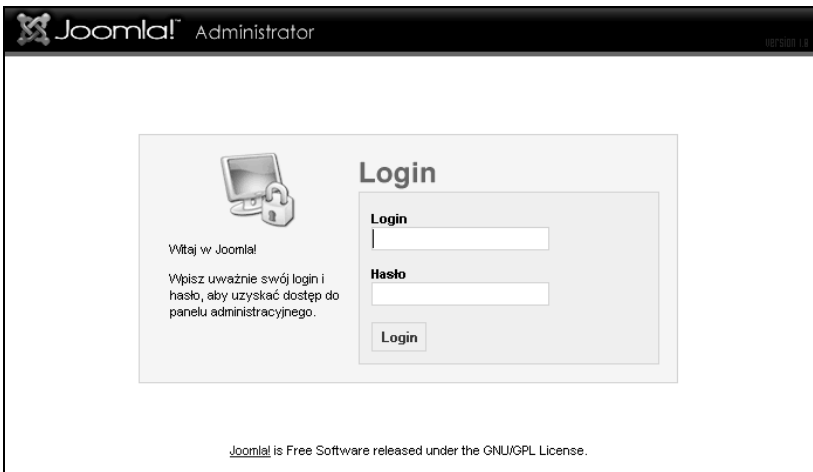
Rysunek 4.1. Joomla! 1.0.11 — okno logowania do panelu administracyjnego