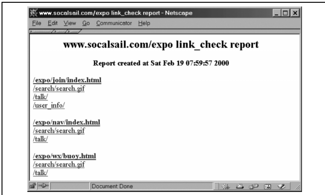
Rysunek 11.1. Raport HTML wytworzony przez link_check.plx

a jego wyniki obejrzyć w przeglądarce, tak jak na rysunku 11.1.