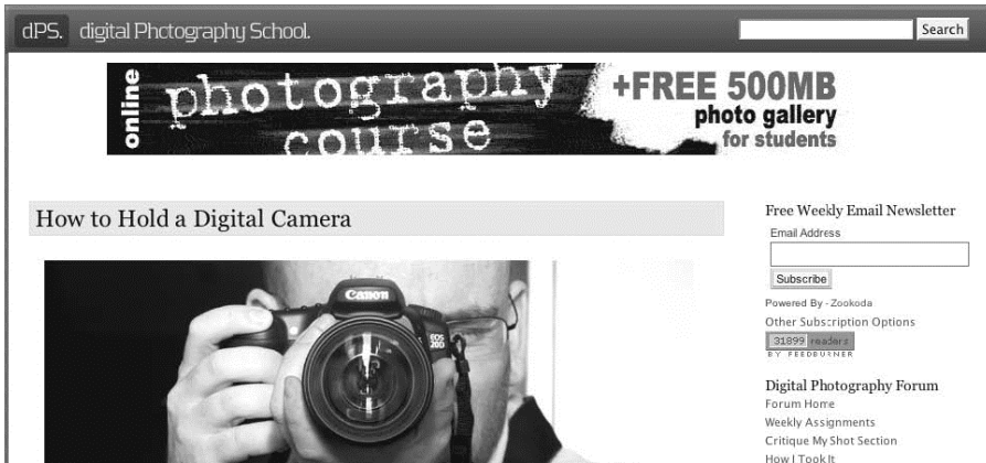
Rysunek 5.1. Najnowszy blog Darrena początkowo był w niewielkim stopniu wykorzystywany do zarabiania