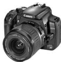
Rysunek 5.6. Darren zamieszcza na swoim blogu linki do produktów sklepu Amazon