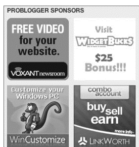
Rysunek 5.2. Kilka przykładowych banerów