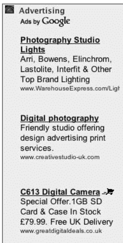
Rysunek 5.3. Przykład reklam tekstowych