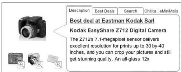
Rysunek 5.4. Chitika eMiniMalls

miałeś kontrolę nad tym, których reklamodawców akceptujesz, a których odrzucasz. Reklamodawcy uwielbiali ten system, gdyż linki wpływały na wyszukiwarkę Google i poprawiały pozycję w wynikach. Dla wielu blogerów linki były głównym źródłem dochodów. Niestety, Google wywołało wielkie publiczne zamieszanie, okazując swoją dezaprobatę dla takich linków, nakładając kary i spychając sprzedaż do podziemia, co odstraszyło wielu blogerów. Nie polecamy sprzedawania linków, chyba że dobrze wiesz, co robisz.