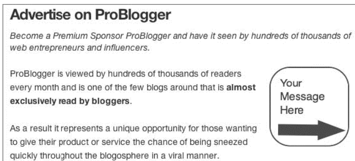
Rysunek 5.5. Przykład strony typu „zareklamuj się tutaj”