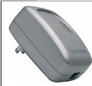
Rysunek 1.4. Klockowaty adapter Powerline Ethernet pozwala podłączyć komputer do sieci równie łatwo jak suszarkę do włosów do prądu. Wystarczy włożyć adapter do najbliższego gniazdka elektrycznego i jeden koniec kabla Ethernet do gniazda na dole obudowy, a drugi do komputera.

Wielką zaletą Powerline jest to, że gniazdka elektryczne można znaleźć w każdym pomieszczeniu (o ile ktoś nie mieszka w szałasie), co ułatwia zbudowanie sieci domowej.