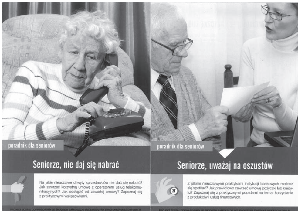
Rysunek 13.1. Przykład informatora stworzonego przez zarząd województwa świętokrzyskiego w celu ostrzegania starszych ludzi przed nieuczciwymi handlowcami

Przykłady nieetycznych zachowań wobec konkurencji to: