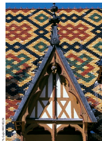
Szczegół stropu przytulki w Beaune

W sali Polipityku wystawiony jest Sąd Ostateczny☆☆☆ Rogera Van der Weydena (1400–1464). Ten wspaniały zabytek sztuki flamandzkiej powstał w latach 1445–48, na zamówienie Nicolasa Rolin. Sąd Ostateczny przedstawiony jest w sposób tradycyjny, z wielkim wyczuciem przestrzeni, detalu i koloru. W centrum umieszczony jest Chrystus w towarzystwie Matki Boskiej i Jana Chrzciela. Przedstawiony na pierwszym planie Św. Michał waży dusze. Warto zwrócić uwagę na ekspresyjność każdej z postaci. Na bocznej ścianie znajdują się panele z tylną stroną nastawy polipityku. Znajdziemy wśród nich zarówno portrety fundatorów – Nicolasa Rolin i jego małżonki, jak i monochromatyczne malowidła en grisaille , utrzymane w odcieniach szarości.