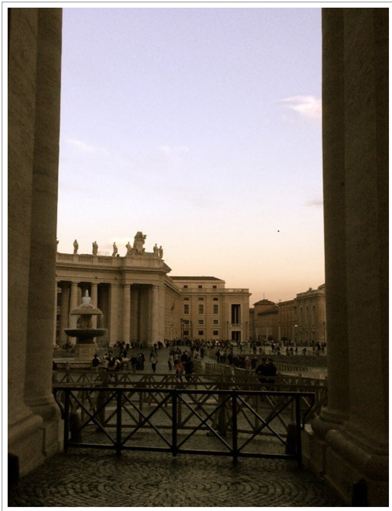
Ryc. 2. Watykan. Widok na plac św. Piotra.