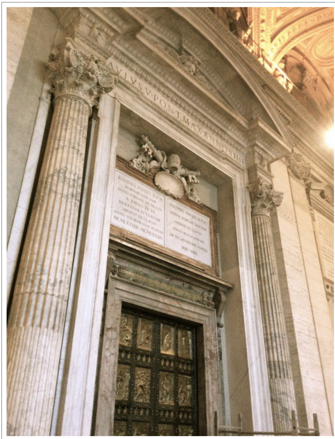
Ryc. 1. Święte Drzwi. Artysta Vico Consorti.