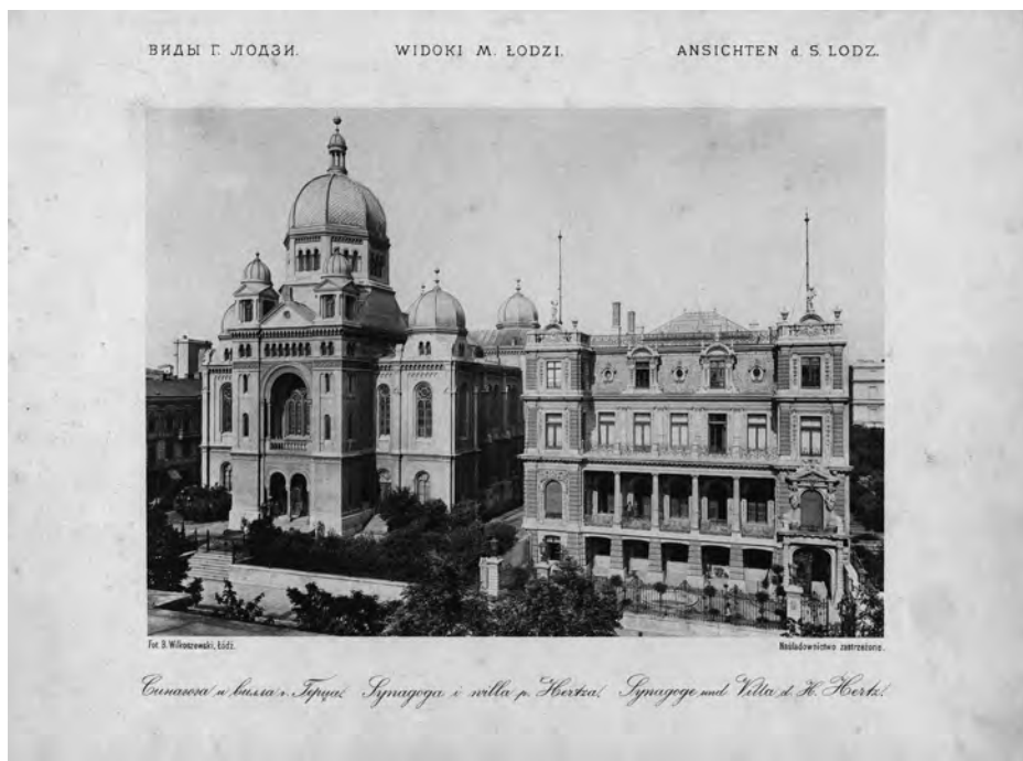
Il. 4. Synagoga i willa p. Hertza.

Łódź jest miastem bardzo mało na piękno plastyczne wrażliwym [...]. Przemysłowcy łódzcy wolą daleko bogate tkaniny meblowe, przepych w mieszkaniach nie zawsze smaczny – wreszcie łokciowe malowidła zagraniczne niż rzecz prawdziwie piękną – dzieło sztuki. Gdy wejdiesz do mieszkania bogatego kupca lub fabrykanta, ten oprowadziwszy cię po swem lokum, powie przedewszystkiem, co kosztuje każda rzecz – bo dla niego tyle ma tylko wartości, ile za nią zapłacił 7 .