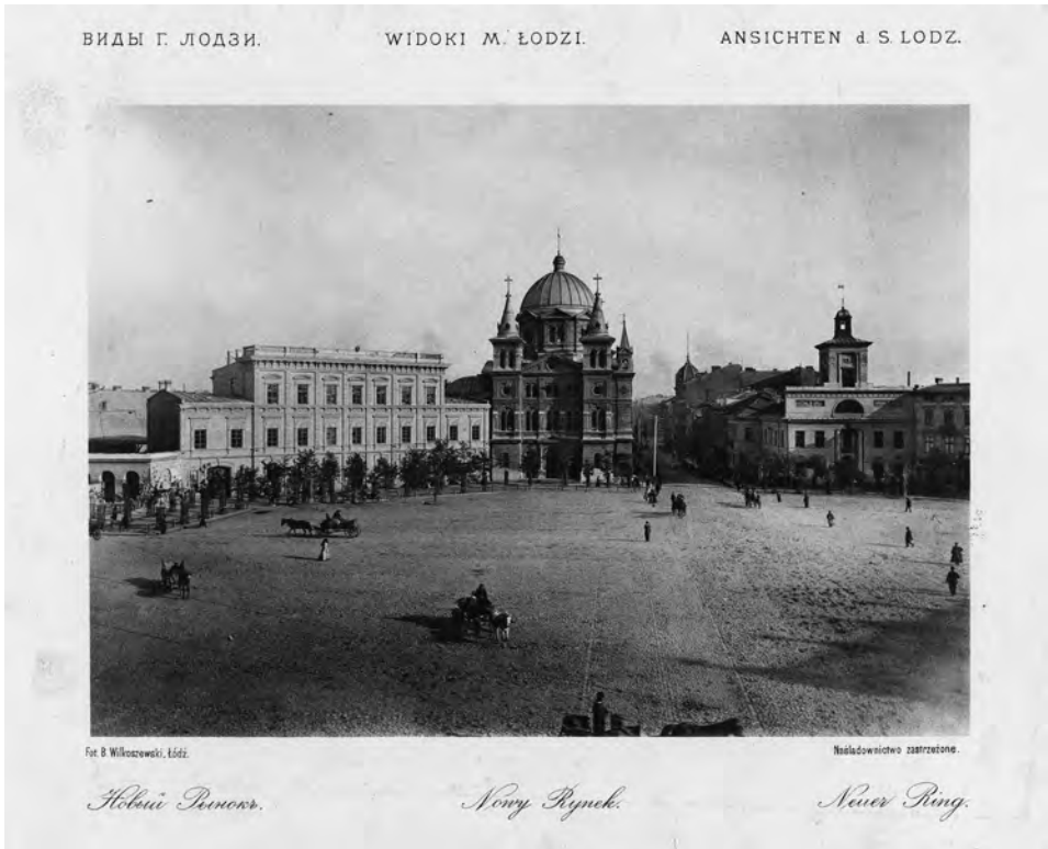
Il. 1. Nowy Rynek. Wg: Bronisław Wilkoszewski, Widoki m. Łodzi , Łódź 1896

Okres żywiołowego rozwoju w dziejach miasta rozpoczął się w drugiej połowie lat sześćdziesiątych, po przezwyciężeniu skutków „kryzysu bawełnianego” – wywołanego wojną secesyjną w Stanach Zjednoczonych – i powstania styczniowego. Uwłaszczenie na ziemiach Królestwa Polskiego chłopów, otwarcie rynków rosyjskich, a następnie połączenie miasta z siecią linii kolejowych otworzyło przed nim szersze perspektywy. Do Łodzi zaczęła przybywać z okolicznych wsi rzesza poszukujących pracy ubogich ludzi, ale też nowa fala przybyszów z Niemiec, szukających tutaj możliwości prowadzenia interesów, co wiązać należy z tzw. epoką grynderską. Zwiększyła się również znacznie liczba ludności żydowskiej, zajmującej się drobną wytwórczością i handlem.