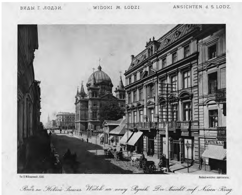
Il. 2. Widok na Nowy Rynek. Wg: B. Wilkoszewski, Widoki m. Łodzi , Łódź 1896

to miasto gorączkowej pracy i codziennej krzątaniny ludzi mówiących różnymi językami: polskim, niemieckim, jidysz i rosyjskim. Pojawił się charakterystyczny dla miasta typ Lodzermenscha – człowieka bez narodowości, którego religią był zysk i pieniądź 4 . Wiodącym tematem rozmów były tutaj interesy. Jak dosadnie napisano u schyłku XIX wieku: „[...] w szalonym iście rozwoju swym Łódź włożyła cały zapas żywotnych swych sił w troskę około materialnego a nie intelektualnego bytu” 5 . Taki drapieżny obraz Łodzi odmalował Władysław Reymont w znakomitej książce Ziemia obiecana , a negatywny wizerunek pogłębiły kolejne