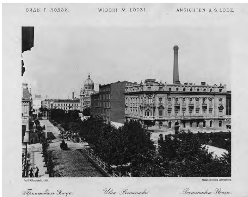
Il. 3. Ulica Promenada. Wg: B. Wilkoszewski, Widoki m. Łodzi , Łódź 1896

Bezpośrednie rządy rosyjskie po zniesieniu autonomii Królestwa Polskiego, w ramach represji po powstaniu styczniowym, skutkowały zaniechaniem jakiegokolwiek troski o racjonalny rozwój miasta, brakiem działań zapewniających właściwy rozwój przestrzenny, rozwój szkolnictwa czy też opieki zdrowotnej. Nastąpiło fatalne w skutkach przemieszanie zabudowy mieszkaniowej i przemysłowej, brak było wodociągów i kanalizacji, stan zdrowotny mieszkańców należał do najgorszych w Europie. Wobec indolencji zaborczych władz rosyjskich miasto zdane było tylko na siebie, na inicjatywy fabrykantów, choć oni też mieli ograniczone możliwości.