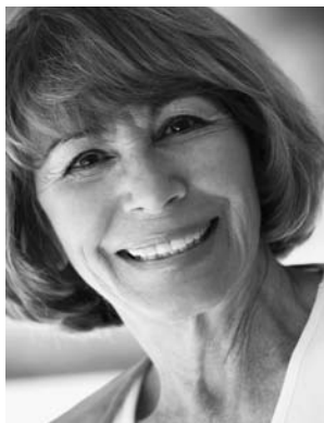
RYSUNEK 2.6. Przykładowe zdjęcie awatara – kobieta w wieku 55 lat

Codziennie dostarczanie wapnia opóźnia rozpoczęcie procesu starzenia o 30% i nadaje ciału witalności.