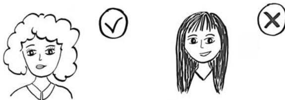
RYСУNEK 2.4. Przykład segmentu klienckiego – dla kobiety w średnim wieku akceptacja, dla studentki brak akceptacji

miastach Polski, pracujące zawodowo na etacie oraz prowadzące własną działalność gospodarczą, uprawiające sport, posiadające konto na Facebooku, poprzez które regularnie kontaktują się ze swoimi znajomymi