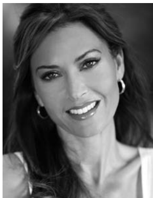
RYSUNEK 2.5. Przykładowe zdjęcie awatara – kobieta w wieku 35 lat

dla skuteczności Twoich działań. Załóżmy, że masz sklep internetowy z suplementami diety lub kosmetykami. W tej branży ważne są płeć i wiek jako podstawowe wyróżniki klienta w kontekście doboru produktów dla niego. Jeśli chciałbyś zrobić kampanię uświadamiającą, że kobiety po 30. roku życia tracą z organizmu wapń i dlatego powinny spożywać go w suplementach, to nie możesz wrzucić do jednej grupy reklamowej wszystkich kobiet po trzydziestce, bo inaczej wygląda ta w wieku 35 lat (patrz rysunek 2.5), a inaczej ta w wieku 55 (patrz rysunek 2.6). Potrzebne więc Ci jest kilka różnych komunikatów odpowiadających na adekwatne potrzeby i obawy grupy wiekowej.