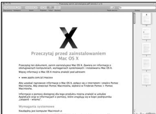
Rysunek 1.6. Na dysku instalacyjnym znajdują się trzy dokumenty, w tym jeden bogato ilustrowany przewodnik instalacji Mac OS X 10.5