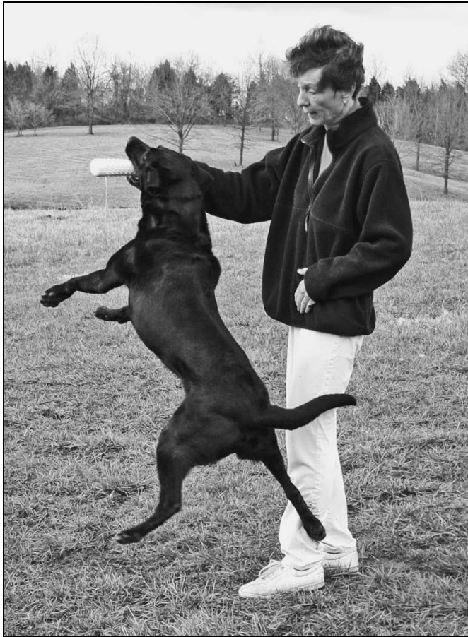
Rysunek 5.1. Pies wykazuje typowe zachowania związane z popędem łowczym